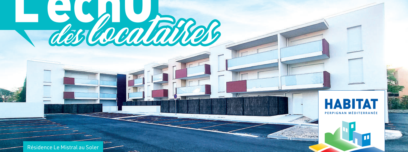
Résidence Le Mistral au Soler