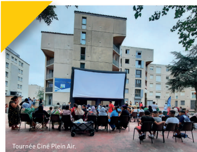
Tournée Ciné Plein Air.

Pour favoriser la mixité et participer au bien-être de ses résidents, L'ESH HPM a proposé cet été 4 soirées gratuites de cinéma en plein air programmées chaque mardi du 11 juillet au 1 er août et assurées par l'association Cinémaginaire.