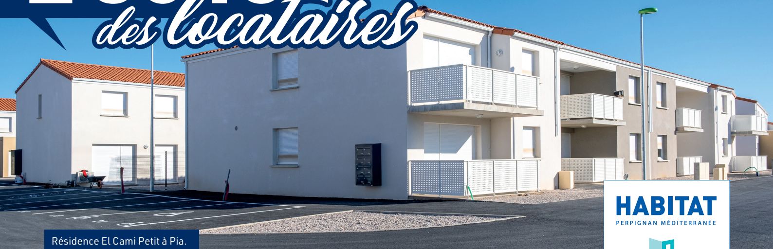
Résidence El Cami Petit à Pia.