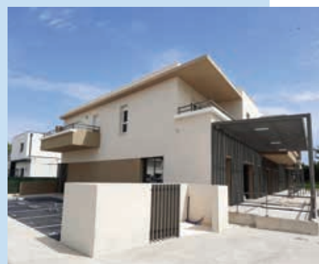
EDEN, un petit paradis pour les nouveaux acquéreurs !