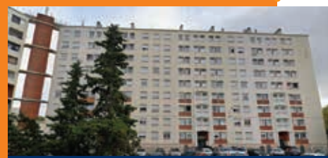
Le bâtiment 3 sera détruit cet été.

Le montant total des travaux s'élève à 819 301 € HT. La fin du chantier, confié à 3 entreprises de travaux publics expertes en démolition (BUESA, CAMAR et SEMPERE & FILS), est prévue à la rentrée.