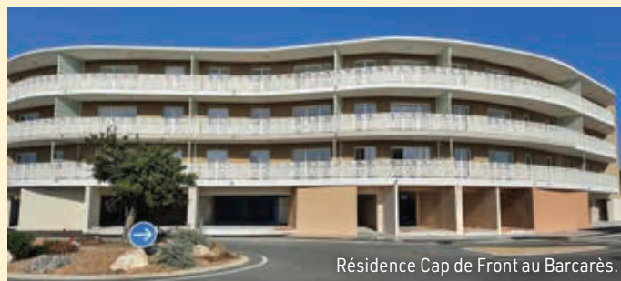
Résidence Cap de Front au Barcarès.

Le coût de cette opération s'élève à 2 147 086 €. Nous remercions nos partenaires financiers qui ont participé à son financement : Préfecture des Pyrénées-Orientales, La Région Occitanie, le Conseil Départemental 66, Perpignan Méditerranée Métropole, la ville de Le Barcarès, l'ADEME et la Banque des Territoires.