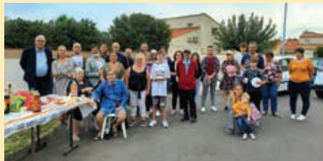
Résidence Le Diégo, Le Soler