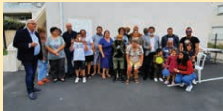
Résidence L'Astilbe, Le Soler