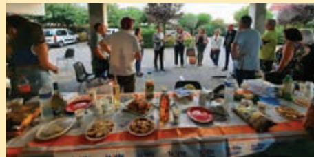
Résidence Les Amandiers, Bompas