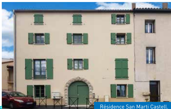
Résidence San Marti Castell.

L'arche en pierre a ainsi été sauvegardée et remise en place à l'issue de la reconstruction qui a donné lieu à un bâtiment de 4 logements (2T2, 1T2 duplex et 1T3 duplex) situés 2 place San Marti à Canet-en-Roussillon.