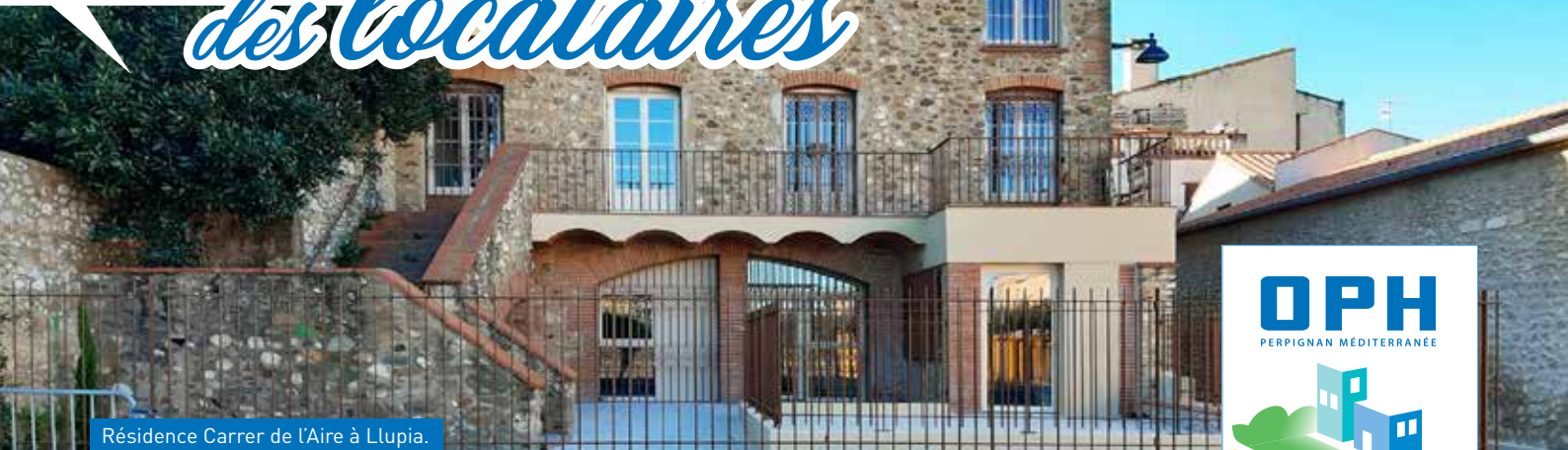
Résidence Carrer de l'Aire à Llupia.