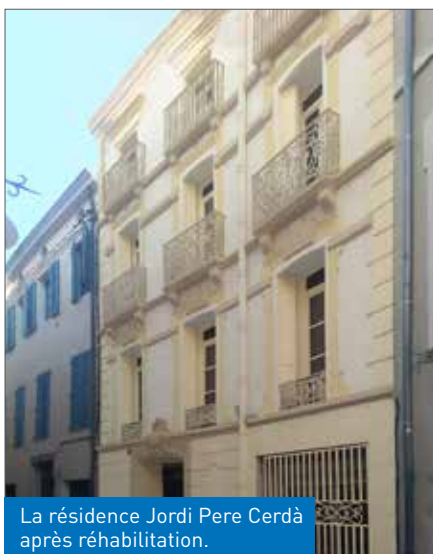
La résidence Jordi Pere Cerdà après réhabilitation.

La façade est en effet classée ABF (Architecte des bâtiments de France). Tout l'enjeu de cette opération est de préserver ce patrimoine, tout en améliorant le confort d'occupation des logements.