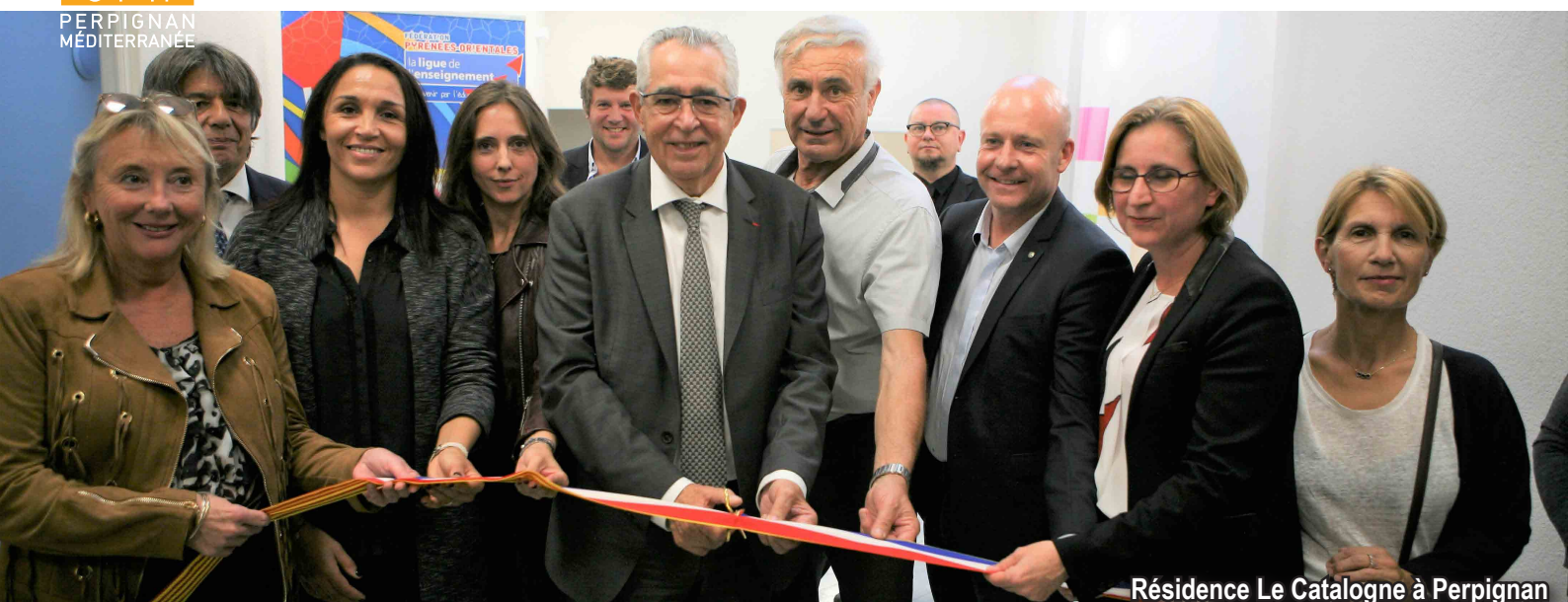
Résidence Le Catalogne à Perpignan